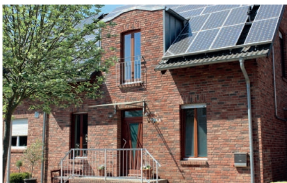
Einfamilienhaus in Rommerskirchen verkauft