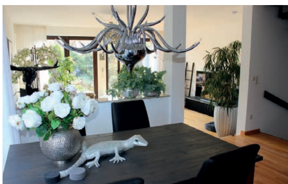
Einfamilienhaus in Brüggen vermietet