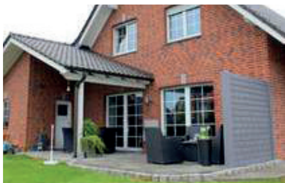
Einfamilienhaus in Hückelhoven verkauft