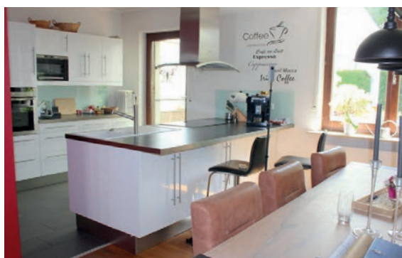
Einfamilienhaus in Mönchengladbach verkauft